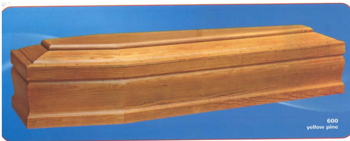
600 yellow pine