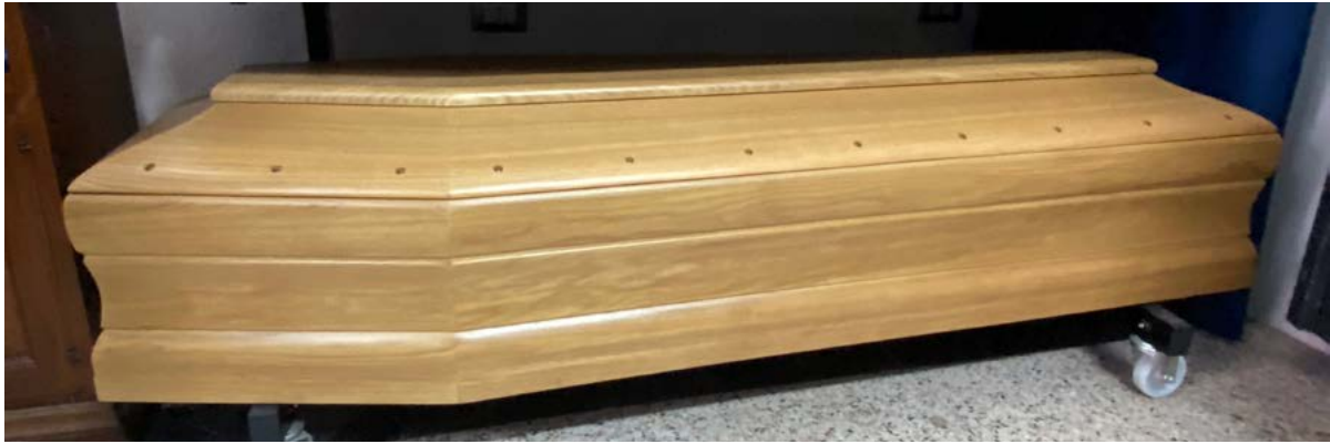
940 Torino Rovere