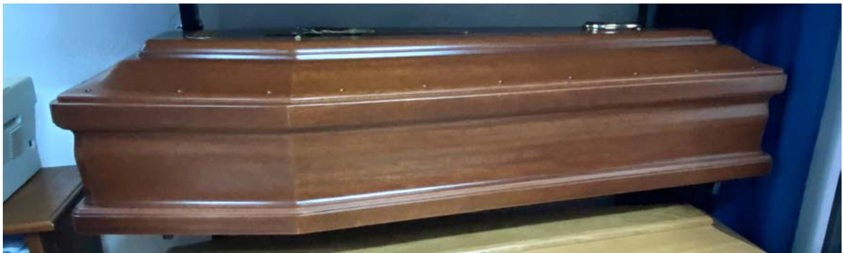
50 Mogano americana