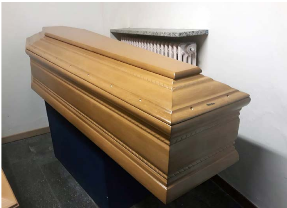
T Cordoncino tiglio