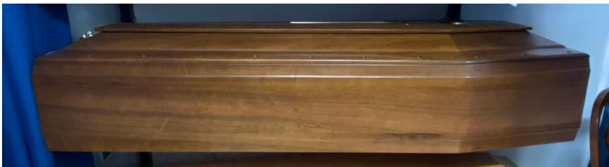
T142 Egizio noce bodè