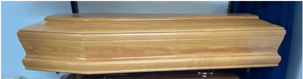
615 yellow pine